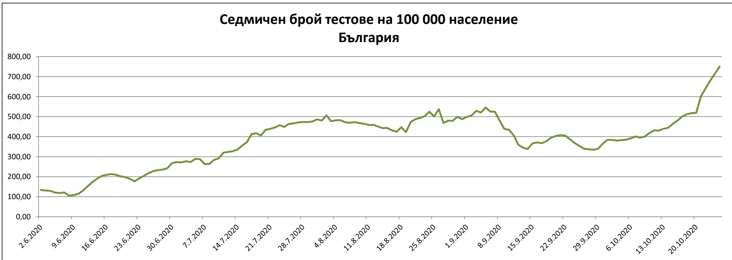
Седмичен брой тестове на 100 000 население България